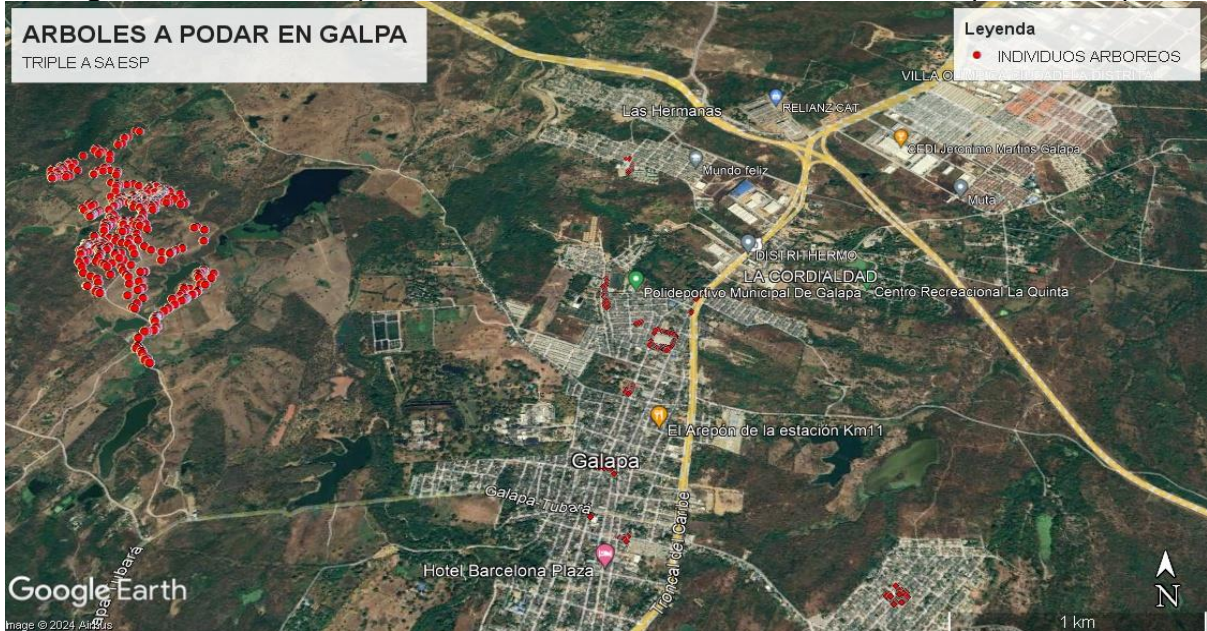
Figura 1. Ubicación especial de los árboles inventariados en el municipio de Galapa

Fuente: CRA 2024, Google Earth pro y Comunicación oficial recibida Radicado No. 202314000064192 del 07 de julio de 2023