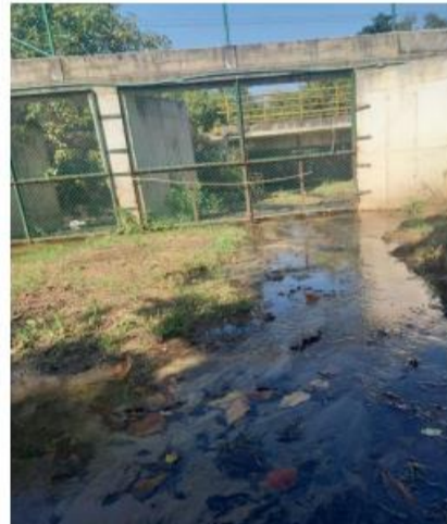
Punto de conexión a quebrada –