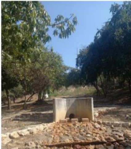
Punto Evidenciado por la CRA – Sin vertimiento muestreo de laboratorio

“POR MEDIO DE LA CUAL SE NIEGA UNA SOLICITUD DE CESACIÓN DE PROCEDIMIENTO SANCIONATORIO AMBIENTAL INICIADO EN RESOLUCIÓN No. 423 DEL 25 DE MAYO DE 2023, CONTRA DE LA SOCIEDAD AGROPECUARIA SAN FERNANDO S.A.S. – ESTABLECIMIENTO DE COMERCIO AGROSAN S.A.S., Y SE TOMAN OTRAS DETERMINACIONES”