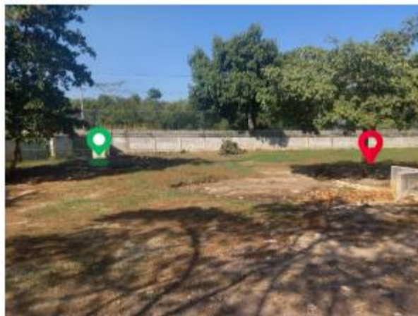
Evidencia de la zona