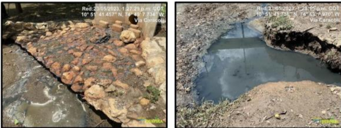
Figura 1. Aguas descargadas con alta turbiedad.

falta de caracterización específica del vertimiento observado en flagrancia el 23 de mayo de 2023 es un vacío crucial, pues no permite una evaluación adecuada del impacto ambiental ni de las medidas correctivas necesarias. Además, el análisis de las condiciones durante la visita revela que no se registraron precipitaciones y que la alta turbiedad del agua descargada (ver Figura 1) no coincide con características de aguas lluvias, reforzando la percepción de un vertimiento inadecuado. Estos hechos apuntan a la necesidad de continuar con el procedimiento sancionatorio para esclarecer completamente los hechos y determinar las responsabilidades pertinentes.