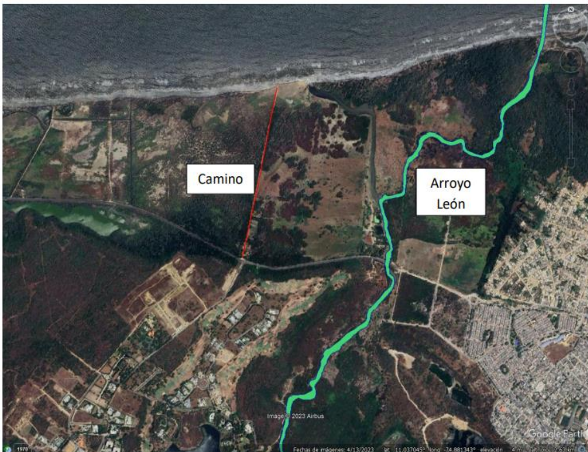
Figura 2. Ubicación del camino de manera distante al cauce del Arroyo León.