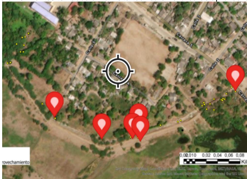
Ilustración 5: Puntos tomados en la visita técnica en el área de aprovechamiento.