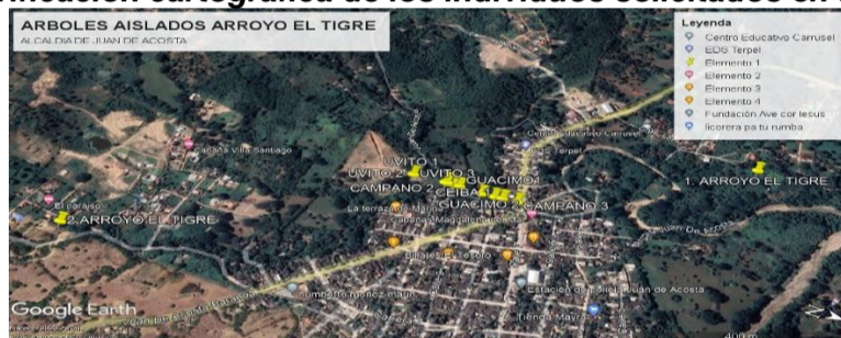
Ilustración 1 Verificación cartográfica de los individuos solicitados en aprovechamiento