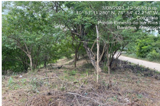
Foto N° 1 Fecha: 3 de Agosto de 2023 Ubicación: Municipio de Baranoa, Atlántico. Observaciones: Punto Inicial, Predios “La Popa” y “La Fe”