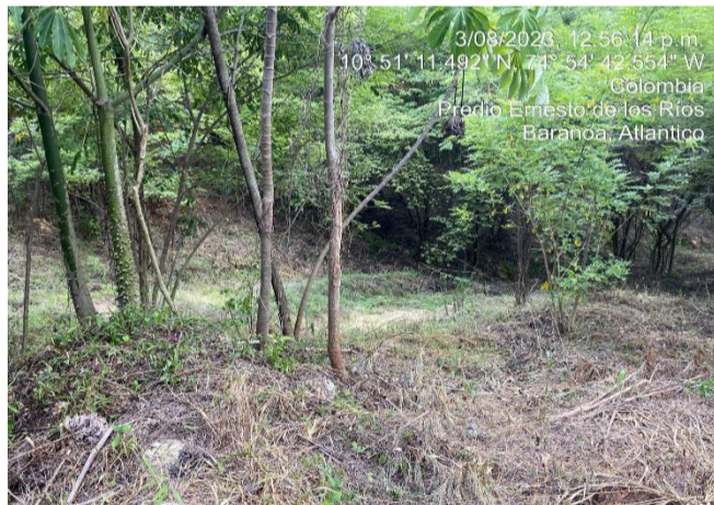
Foto N° 2 Fecha: 3 de agosto 2023 Ubicación: Municipio de Baranoa, Atlántico Observaciones: Punto Inicial, Predios “La Popa” y “La Fe”