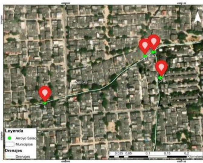
Ilustración 5. Puntos recolectados en la visita técnica.

En este sentido, se recolectaron los siguientes puntos: