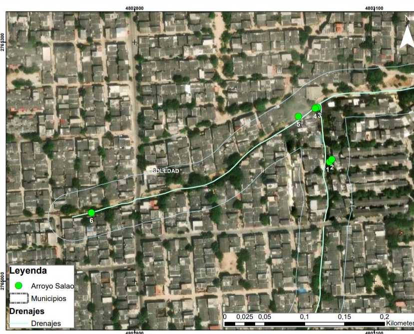
Ilustración 4. Localización de los individuos del inventario forestal de la solicitud de aprovechamiento.