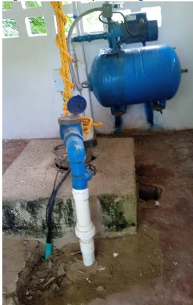
Fotografía 1. Punto de captación de agua subterránea.

El colegio cuenta con una motobomba para la extracción de agua subterránea y tuberías de conducción de PVC hacia 6 tanques de 500 L y 2 tanques de 1000 L, luego se distribuye mediante red cerrada hacia los baños y por aspersión hacia las zonas verdes y canchas deportivas.