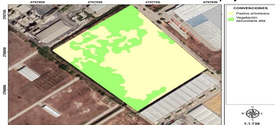
Ilustración 02: Cobertura de la tierra en el área de influencia del proyecto