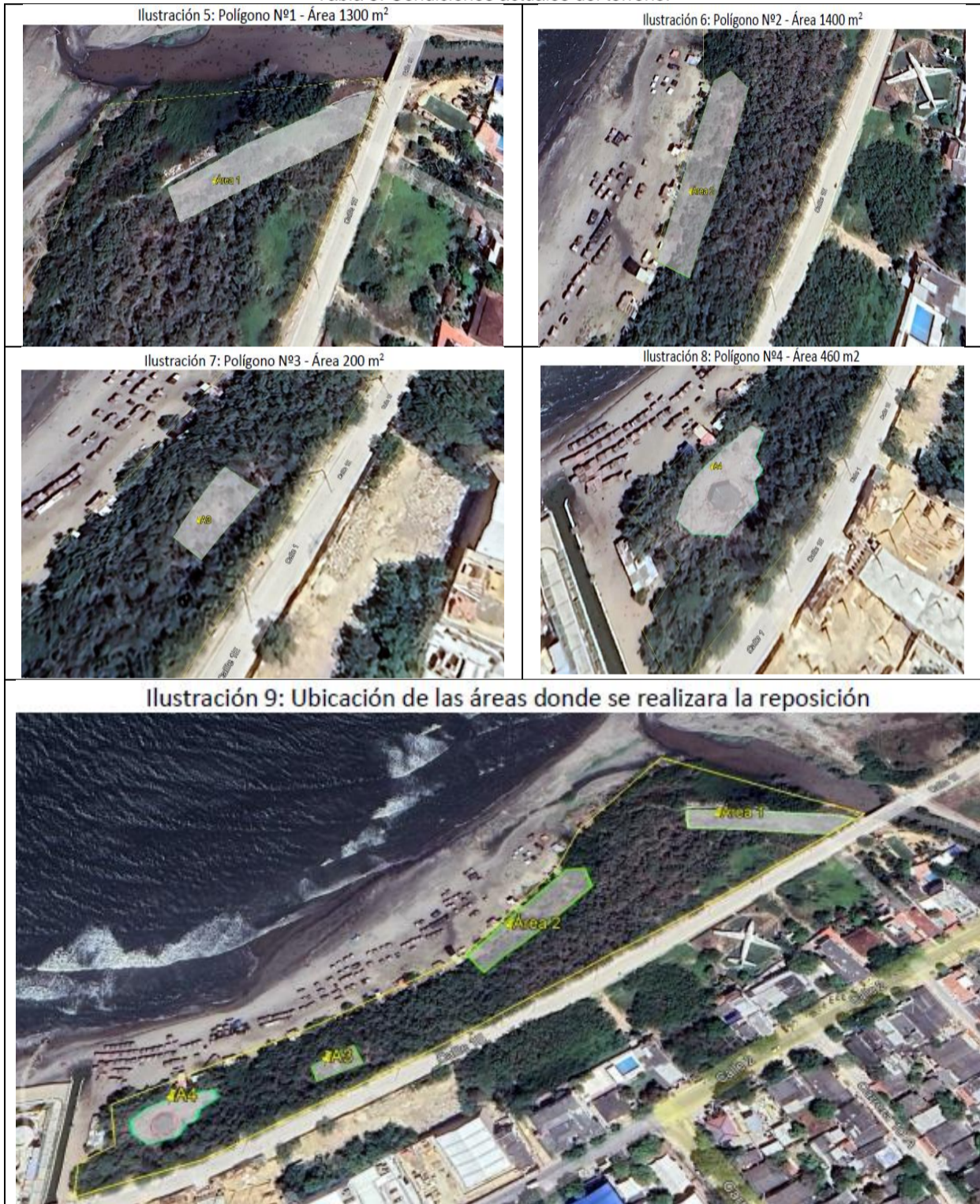
Tabla 5: Condiciones actuales del terreno.