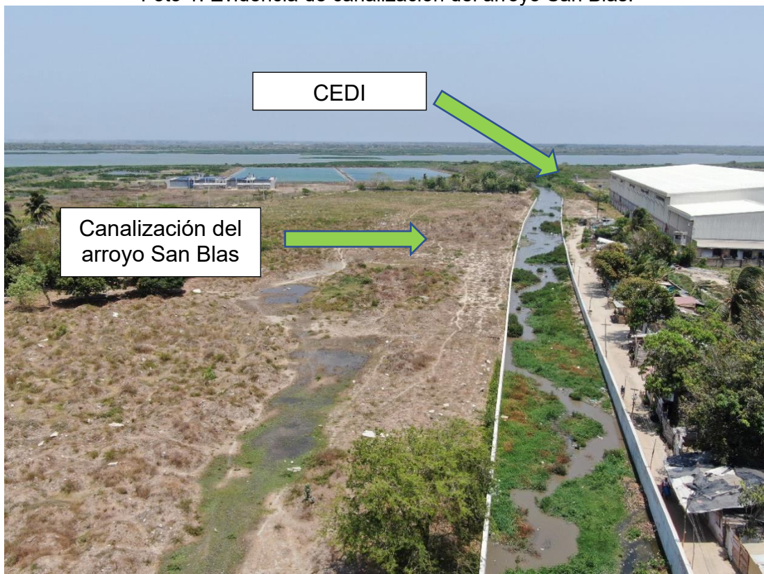
Foto 1. Evidencia de canalización del arroyo San Blas.

Ahora bien, teniendo en cuenta que la Unidad Nacional de Gestión del Riesgo de Desastres (UNGRD) ejecutó la obra de canalización del arroyo San Blas, incluyendo el tramo que colinda con el CEDI Bomboná, no es oportuno realizar trabajos sobre esta obra que fue diseñada para mitigar el riesgo de inundación y de erosión de los terrenos adyacentes.