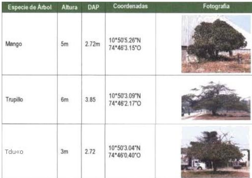
Tabla # 3. Inventario Forestal Inicial

“POR MEDIO DE LA CUAL SE AUTORIZA UNA TALA DE ÁRBOLES AISLADOS AL PARQUE INDUSTRIAL MALAMBO PIMSA, EN JURISDICCIÓN DEL MUNICIPIO DE MALAMBO – ATLÁNTICO.”