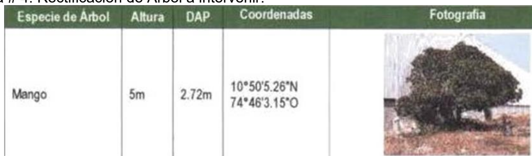
Tabla # 4. Rectificación de Árbol a intervenir.

Información suministrada en el radicado # 100512 del 24 de noviembre de 2021, aportado por Parque industrial Malambo S.A, PIMSA. - con Nit No 860.076.008-5