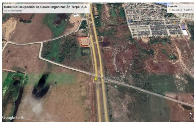
Localización del cauce a intervenir

“POR MEDIO DE LA CUAL SE NIEGA UN PERMISO DE OCUPACION DE CAUCE A LA ORGANIZACIÓN TERPEL S.A., PROYECTO DE LA ESTACION DE SERVICIO SANTO TOMAS, JURISDICCION DEL MUNICIPIO DE PALMAR DE VALERA, DEPARTAMENTO DEL ATLÁNTICO .”