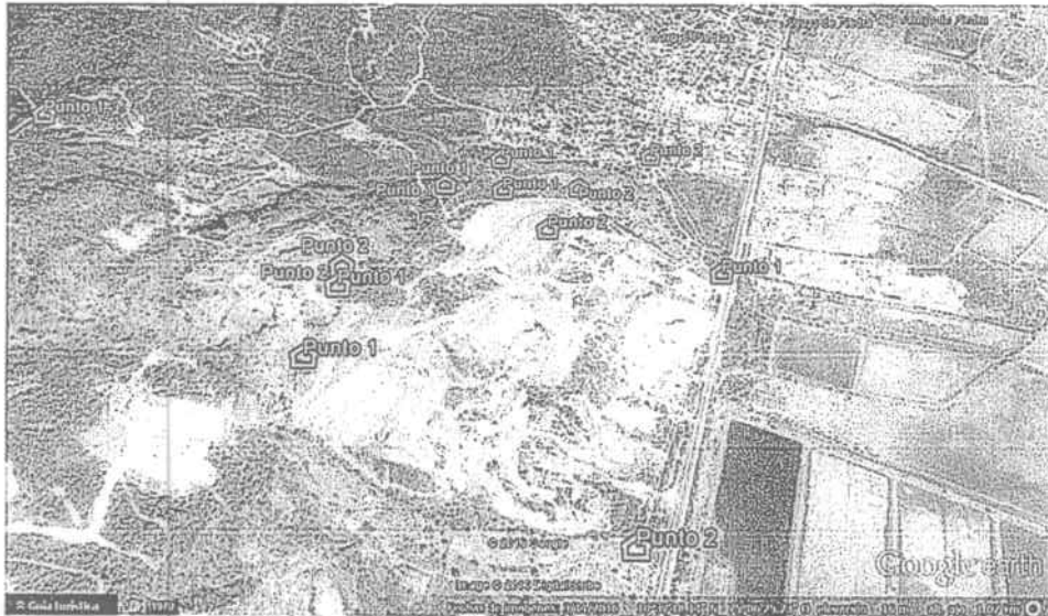
Imagen satelital N° 1 - año 2016

“POR MEDIO DEL CUAL SE HACEN UNOS REQUERIMIENTOS AI SEÑOR ELEAZAR DE JESUS CASTRO MERCADO Y OTROS”