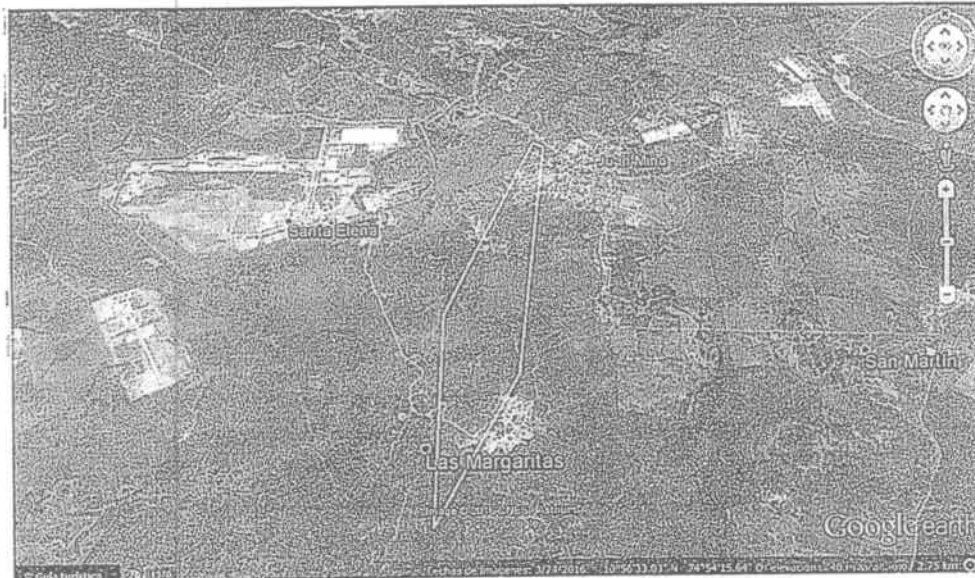
Imagen satelital N° 1 - año 2016, Google earth