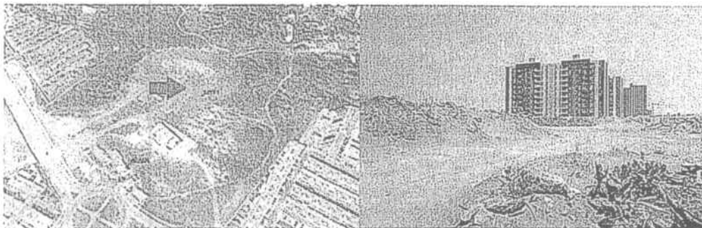
Figura N° 1 – Foto N° 1