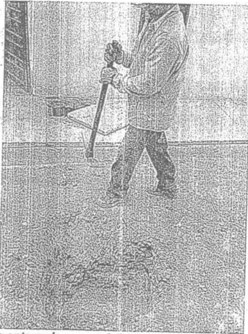
Fotografía No. 1 Poza séptica enterrada a unos 0,5 metros bajo tierra. Se manifiesta que actualmente los residuos contenidos en la poza se disponen con gestor especializado.

19.3- Se generan aguas residuales domésticas provenientes de tres (3) baños y se depositan en una poza séptica enterrada en el suelo. La persona que atendió la visita manifestó que dicha poza séptica es hermética sin infiltración en el suelo.