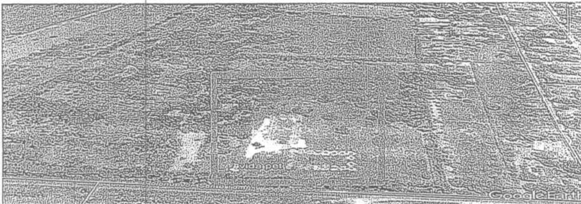
Figura 1. Ubicación de la empresa Vida Pet Plásticos S.A.S.

“POR MEDIO DE LA CUAL SE IMPONE UNA MEDIDA PREVENTIVA DE SUSPENSIÓN DE ACTIVIDADES Y SE INICIA UN PROCEDIMIENTO SANCIONATORIO AMBIENTAL CONTRA DE LA EMPRESA VIDA PET PLASTICOS S.A.S IDENTIFICADA CON EL NIT 900.953.693-7 UBICADA EN EL MUNICIPIO DE SANTO TOMAS - ATLANTICO “