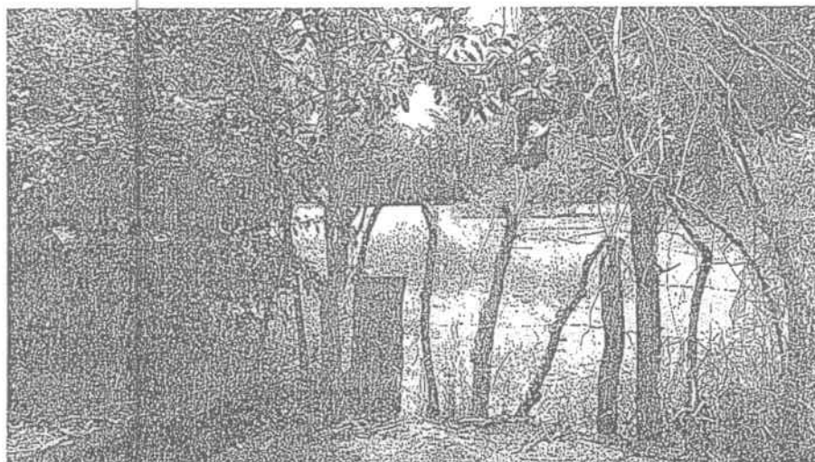
Foto No.1 Jagüey en donde se vierten las aguas residuales de la finca "El Mejor Rincón".

Durante la visita se pudo confirmar que el propietario o administrador de la finca "El Mejor Rincón" no ha tomado las medidas preventivas ni correctivas con respecto a la descarga de las aguas residuales provenientes de la Finca "El Mejor Rincón", como tampoco se evidencia que haya iniciado el trámite del permiso de vertimientos líquidos ante la Corporación Autónoma Regional del Atlántico