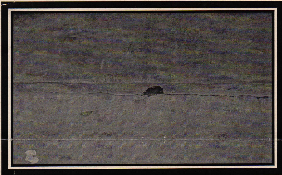
FOTO N° 2 Se observa la salida a la calle del tubo de desahogo de aguas lluvias.