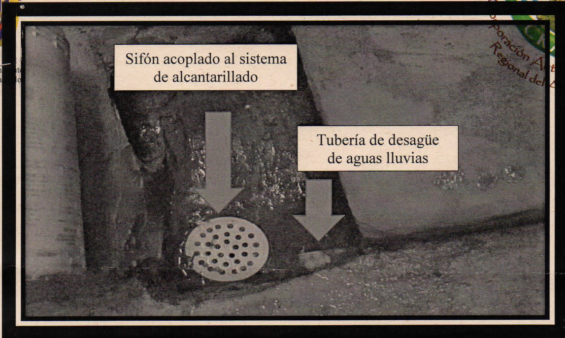
FOTO N° 1 Se observa la unión que se realizó al sistema de alcantarillado

Corporación Autónoma Regional del Atlántico