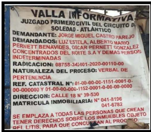
Imagen valla informativa sobre litis:

Que no se conoce, hasta el momento de expedición del presente acto administrativo, trámite adelantado por los hoy investigados para la obtención de permisos para aprovechamiento alguno.