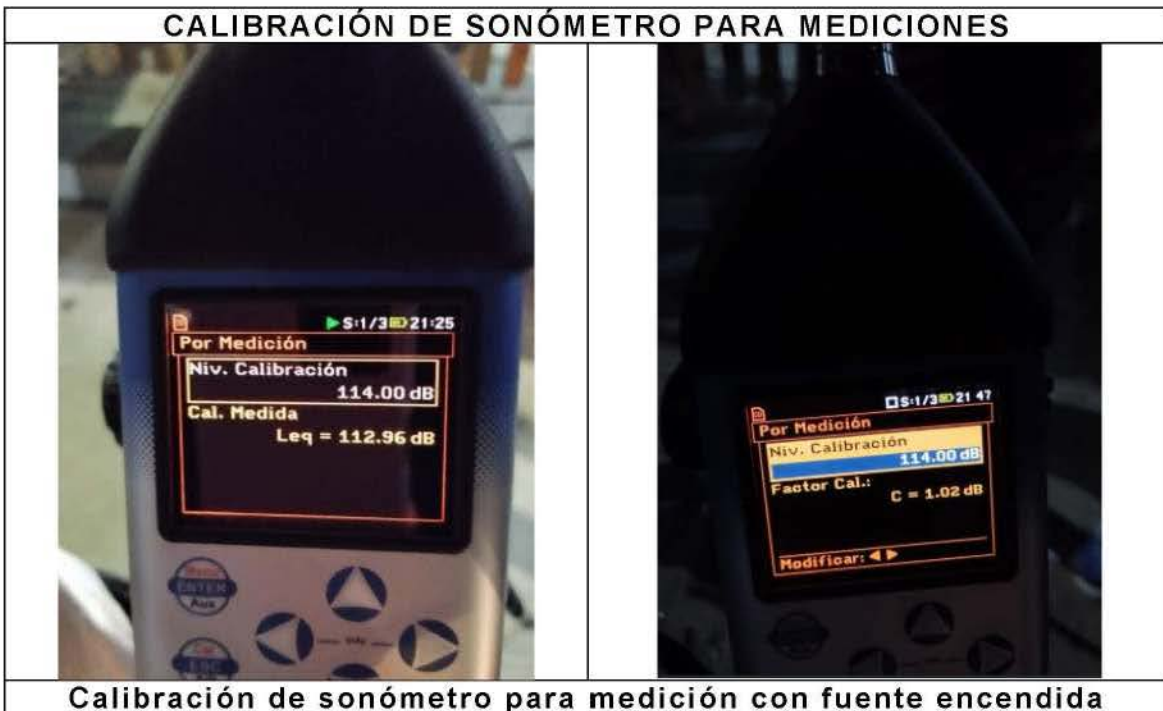
Calibración de sonómetro para medición con fuente encendida