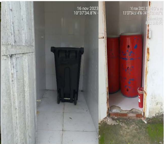
Imagen 3 Área de almacenamiento intermedia para la recolección de los residuos generados en la IPS SAIS