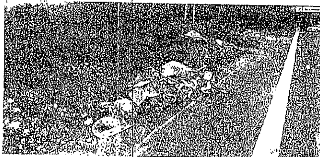
Fecha imagen: Mayo 2016. Nótese la disposición de RDC en el lote

hace más ocho años, el predio objeto del Cerramiento, viene siendo sometido por parte de TERCEROS, (lo cual vendría hacer UN EXIMIENTE DE RESPONSABILIDAD según la ley 1333 de 2009), de ARRUMES DE ESCOMBROS - BASURAS, en el perímetro del predio, los cuales a través de los años han ido formando capas sobre el suelo ya que se trata un lote a cielo abierto, lo cual se puede evidenciar con una vista de inspección ocular al predio, (Ver imágenes históricas anexas).