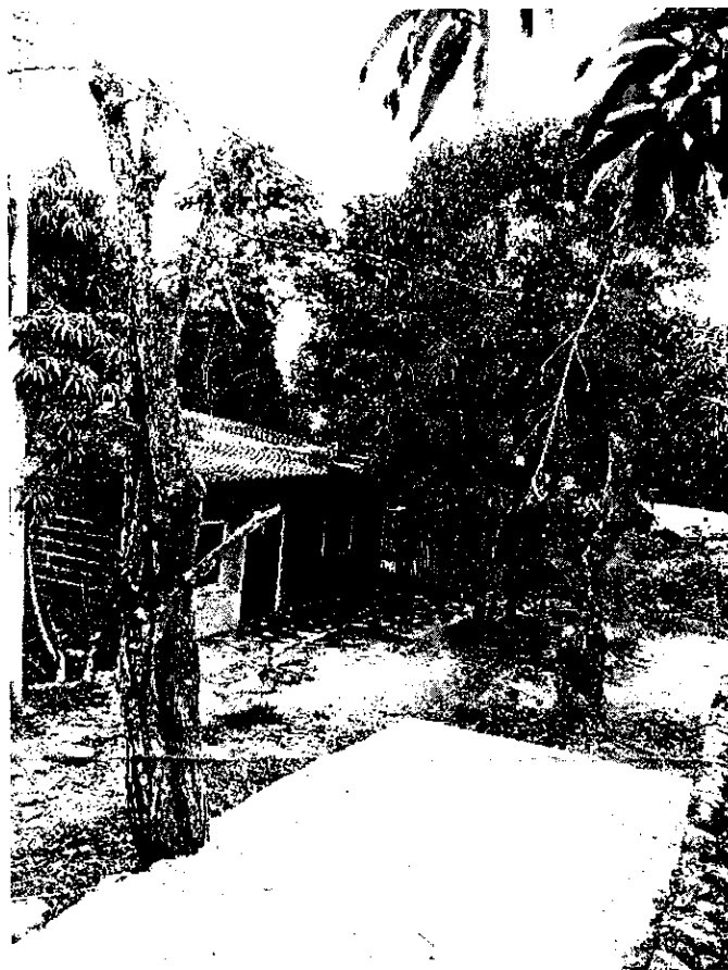
Imagen No. 1 : Árboles de de Totumo ( Crescentia cujete ) y de matarratón ( Gliricidia Sepium ) podados en su totalidad.

Fecha: 09 de julio de 2019 Lugar: Cra 14 No. 22b – 37 Santa Elena. Municipio: Baranoa (Atlántico).