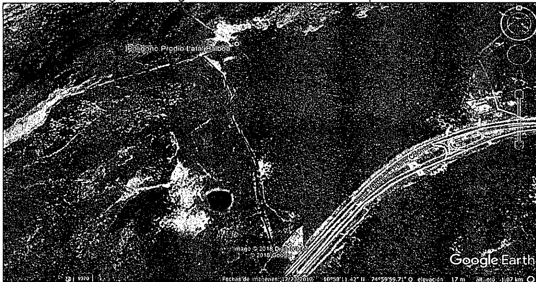
Imagen 2: Polígono del zona intervenida del predio Latal Balboa.

El área intervenida tiene aproximadamente 10 hectáreas donde predomina vegetación asociada a ecosistemas de bosque seco tropical. Es importante mencionar que, hacia la zona norte del predio, predomina un ecosistema de manglar como se observa en la imagen N° 5 (zonificación de manglar).