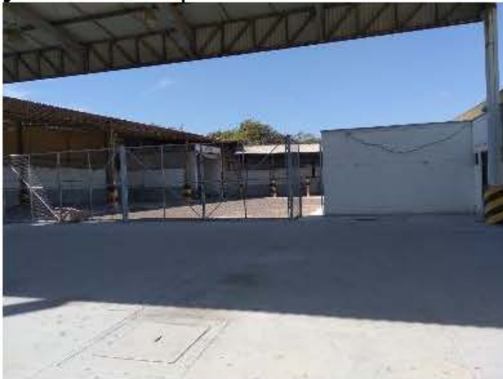
Imagen No.2 Instalaciones de la empresa. Fecha: 12 de enero de 2022.

Las instalaciones se encuentran desalojadas y solamente está la presencia del vigilante y en ocasiones el personal de aseo.