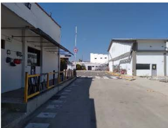
Imagen No.3 Instalaciones de la empresa Fecha: 12 de enero de 2022.