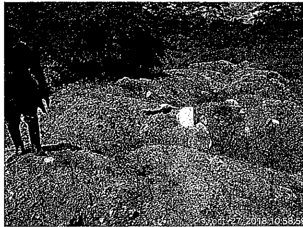
Foto N° 1, 2 y 3 Tomadas el día 27-10-2018 Apilamientos de Residuos de Construcción y Demoliciones