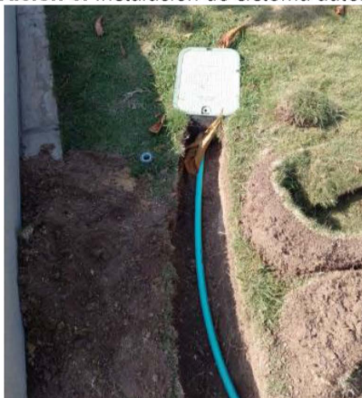
Ilustración 6: Instalación de sistema automático de riego