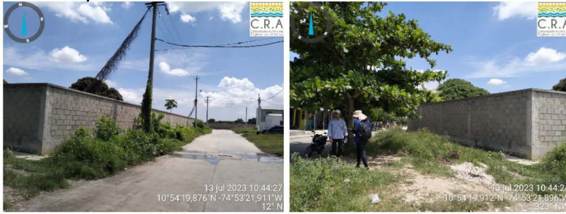
Figura 2 y 3. Registro fotográfico del sector noroeste del proyecto, donde no se realizó el aprovechamiento de individuos fustales autorizados.