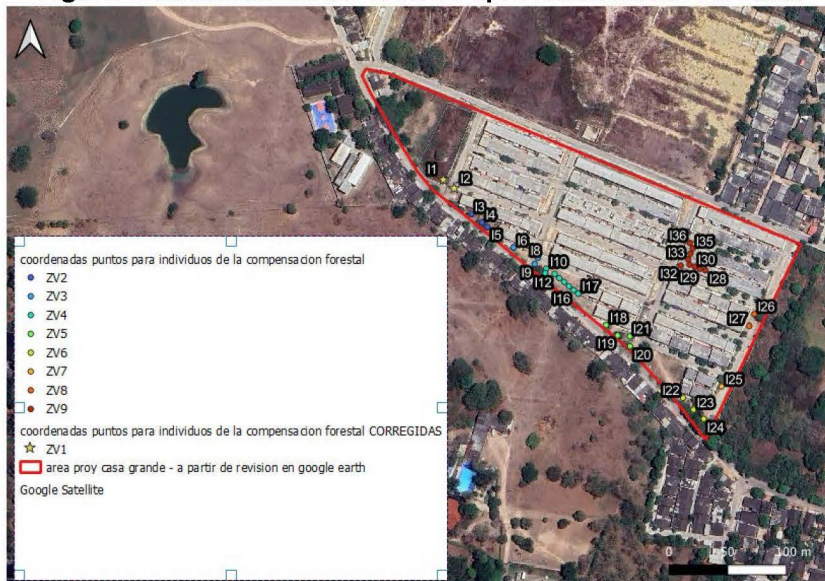
Figura 1. Localización del área de aprovechamiento forestal.