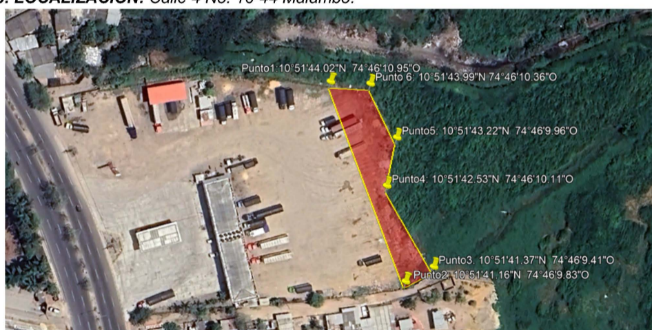
Polígono de Extensión de nuevo relleno con punto de coordenadas