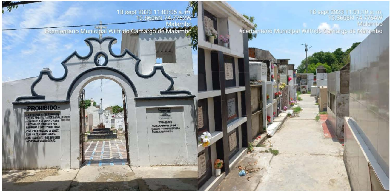
Foto N°1 Entrada y parte interior del Cementerio Municipal Wilfrido Camargo del Municipio de Malambo

POR MEDIO DEL CUAL SE HACEN UNOS REQUERIMIENTOS AL MUNICIPIO DE MALAMBO, IDENTIFICADO CON NIT 890.114.335-1, CON RELACIÓN AL CEMENTERIO MUNICIPAL WILFRIDO CAMARGO DE MALAMBO