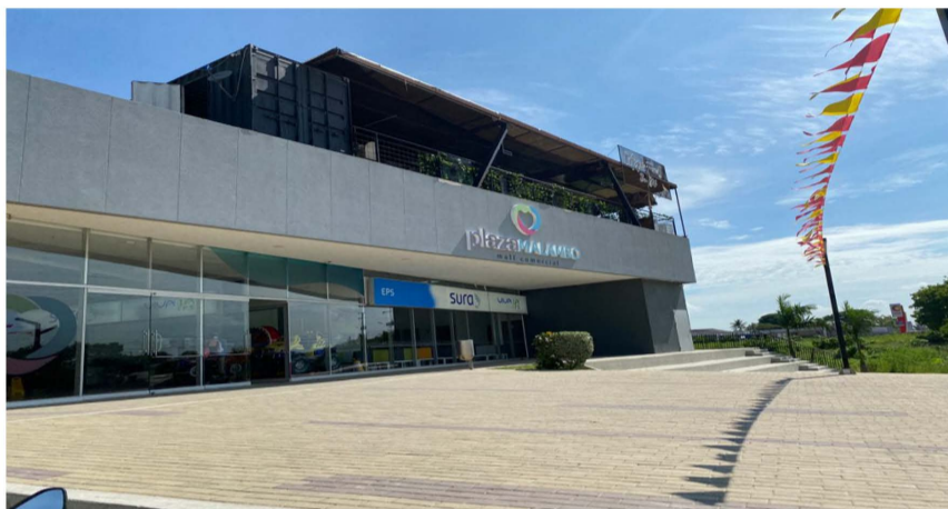
Foto N° 1. Fecha: 12 de agosto de 2024. Ubicación: Centro comercial Plaza Malambo, Observaciones: se evidencia la terminación del proyecto, que se encuentra en operaciones.

Hay un medidor de captación instalado. El agua y el alcantarillado del centro comercial Plaza Malambo la proporciona la empresa aguas de Malambo.