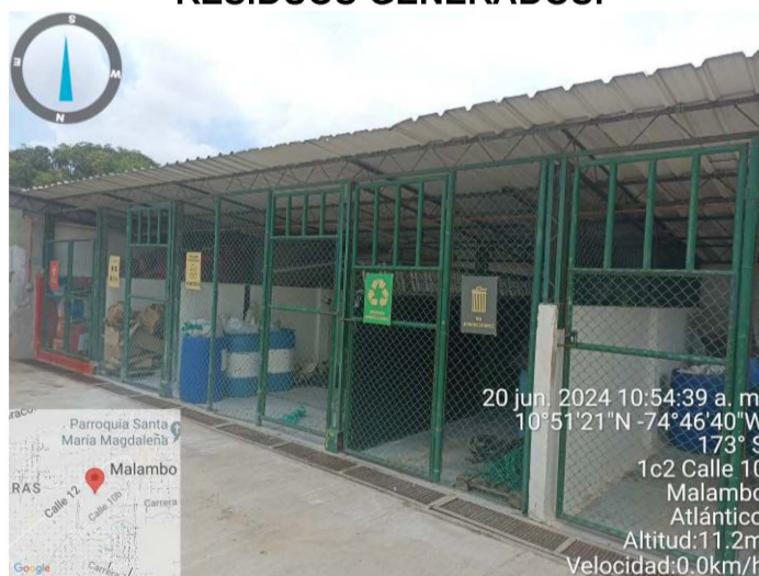
Tomada 20 de junio de 2024

Fotografía No. 3 –CENTRO DE ACOPIO PARA ALMACENAR TEMPORALMENTE RESIDUOS GENERADOS.