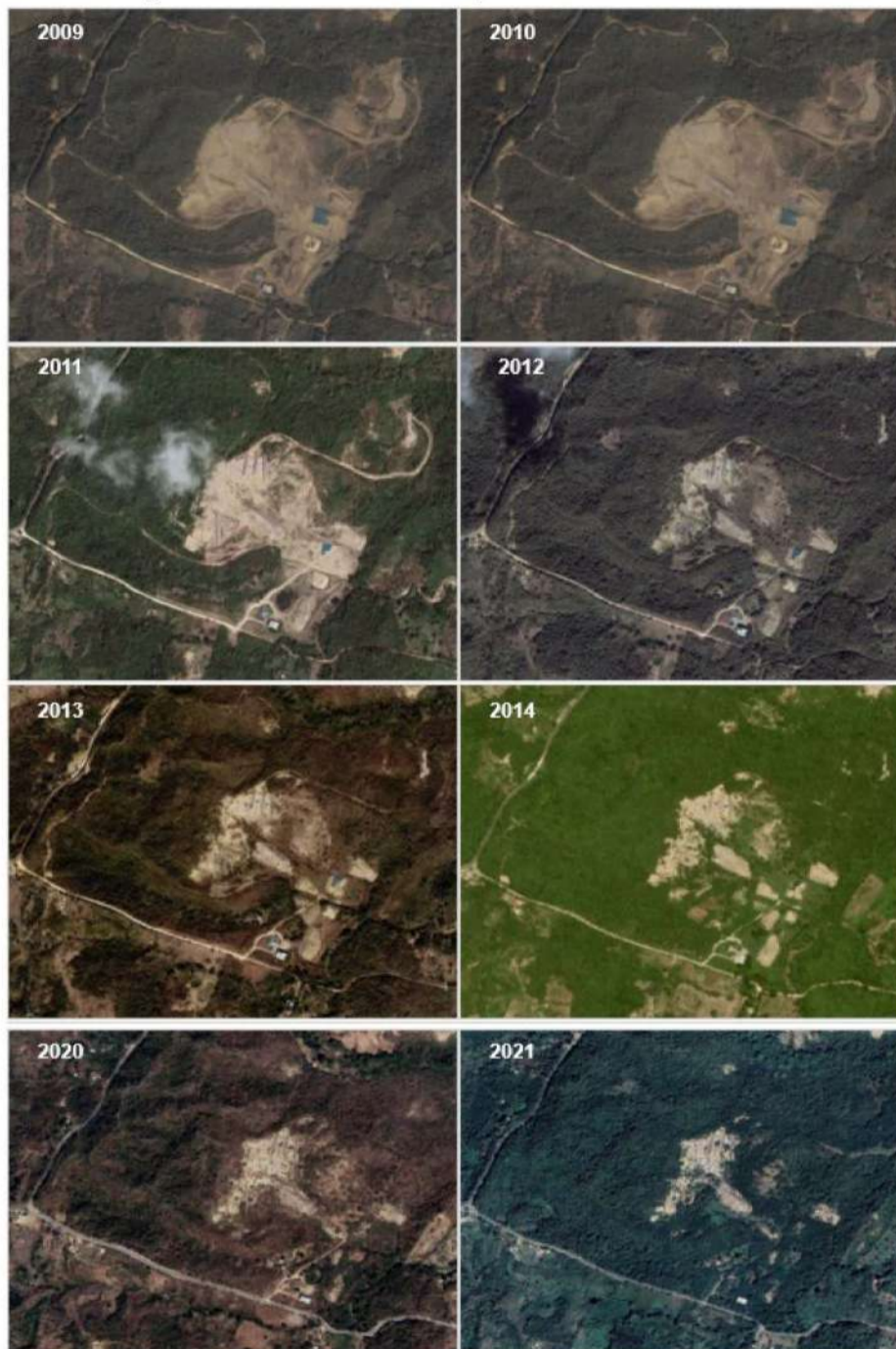
Imagen 4. Análisis multitemporal del área de interés.