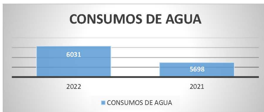
Gráfico 1: consumos de agua 2021-2022.