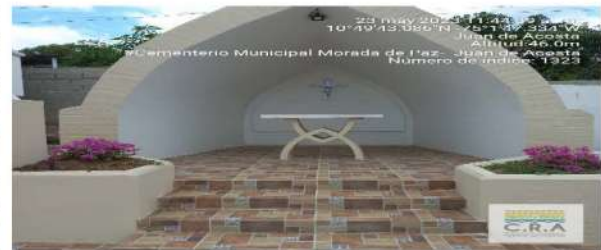
Foto N° 1 Entrada y parte interna del cementerio Municipal Morada de Paz del Municipio de Juan de Acosta.