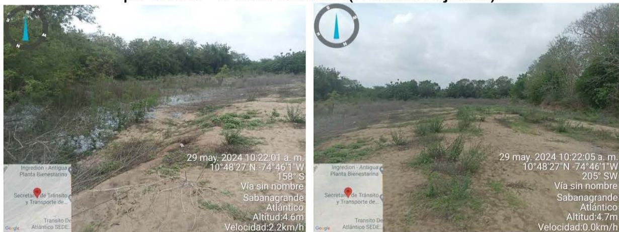
Tomada 29 de mayo de 2024