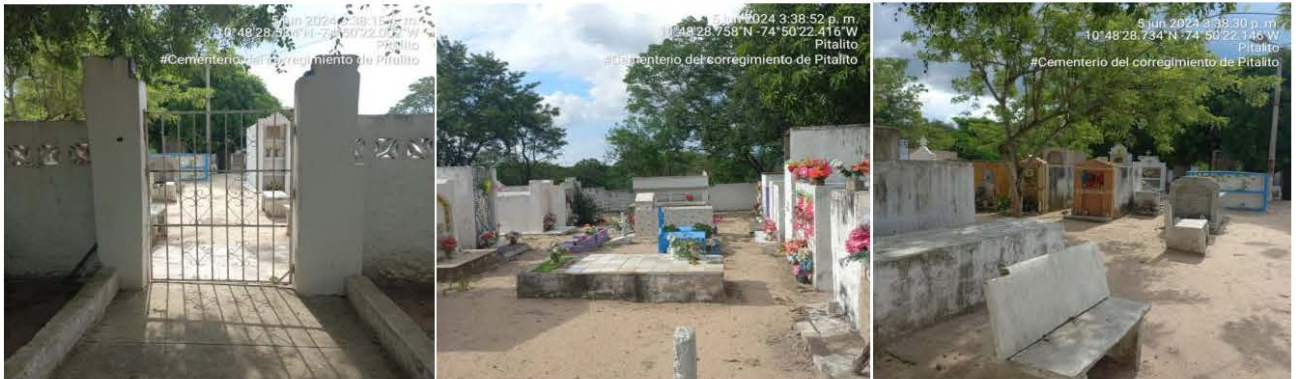
Imagen No. 1 Parte exterior e interior del Cementerio de Pitalito.

El Cementerio del corregimiento de Pitalito, ubicado en el municipio de Polonuevo – Atlántico, es una entidad pública que se encuentra realizando su actividad en la prestación de servicios de inhumación y exhumación. Actualmente no cuenta con un horario establecido.