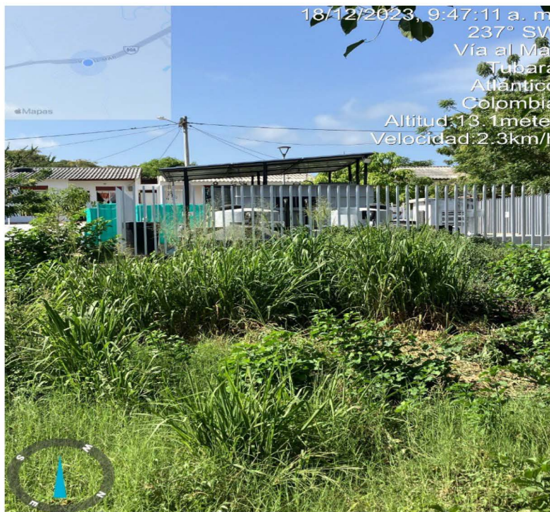
Foto 4 PTARD Fecha: 18 de diciembre de 2023 Lugar: Comfamiliar Turipana

Observaciones: agua del arroyo después de la descarga de la PTARD de la urbanización Nueva Esperanza, apariencia negruzca de las aguas del arroyo