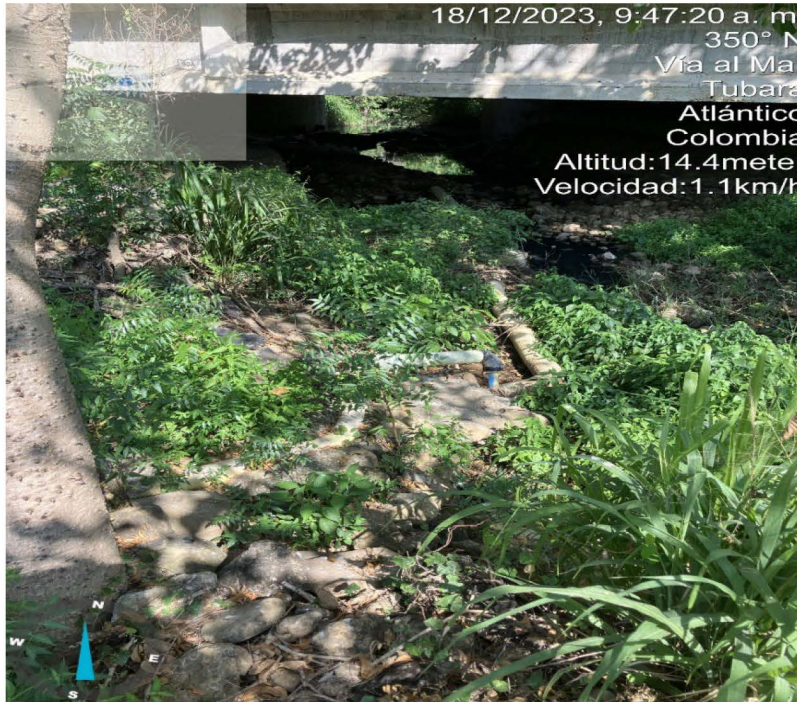
Foto 5 Descarga de la PTARD hacia el arroyo Palmarito Fecha: 18 de diciembre de 2023 Lugar: Comfamiliar Turipana

POR EL CUAL SE DA INICIO A UN TRÁMITE ADMINISTRATIVO AMBIENTAL DE CARÁCTER SANCIONATORIO EN CONTRA DEL MUNICIPIO DE TUBARA, ATLANTICO, IDENTIFICADO CON NIT. 800.053.522-3