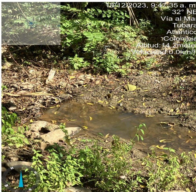
Foto 6. Arroyo antes de la descarga de la PTARD de la urbanización nueva esperanza Fecha: 18 de diciembre de 2023 Lugar: Comfamiliar Turipana

(57-5) 3492482 – 3492686 repcion@crautonomia.gov.co Calle 66 No. 54 -43 Barranquilla - Atlántico Colombia www.crautonomia.gov.co