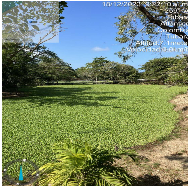
Foto 1. Lago interno de comfamiliar Fecha: 18 de diciembre de 2023 Lugar: Comfamiliar Turipana

POR EL CUAL SE DA INICIO A UN TRÁMITE ADMINISTRATIVO AMBIENTAL DE CARÁCTER SANCIONATORIO EN CONTRA DEL MUNICIPIO DE TUBARA, ATLANTICO, IDENTIFICADO CON NIT. 800.053.522-3 REGISTRO FOTOGRÁFICO