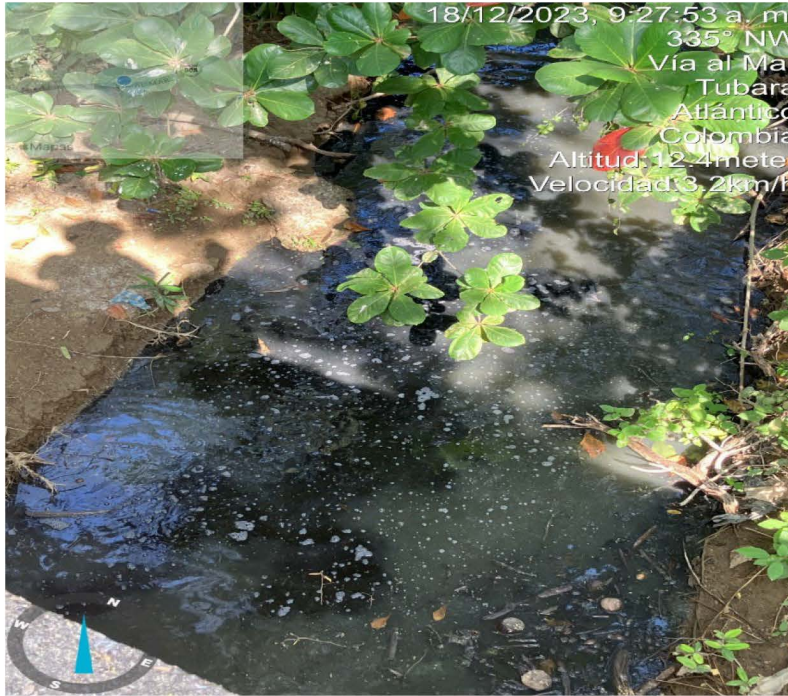
Foto 3. Arroyo Palmarito Fecha: 18 de diciembre de 2023 Lugar: Comfamiliar Turipana

POR EL CUAL SE DA INICIO A UN TRÁMITE ADMINISTRATIVO AMBIENTAL DE CARÁCTER SANCIONATORIO EN CONTRA DEL MUNICIPIO DE TUBARA, ATLANTICO, IDENTIFICADO CON NIT. 800.053.522-3