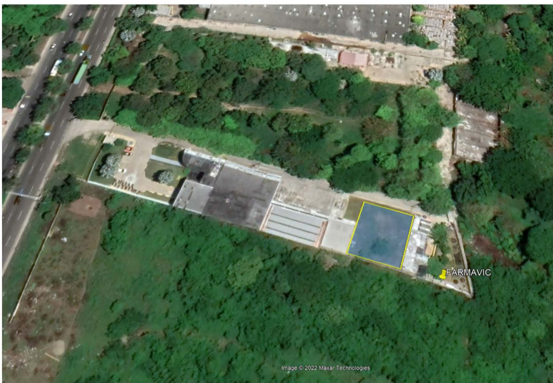
Ubicación del sistema de tratamiento de aguas residuales de FARMAVIC.

Actualmente sus aguas residuales son tratadas en un sistema compuesto por los siguientes elementos.