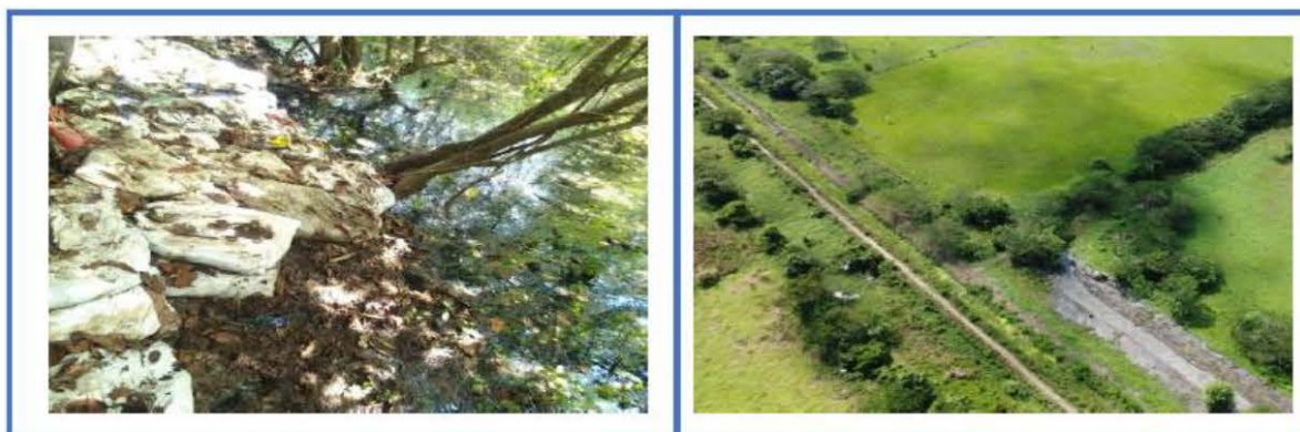
Ilustración 9. Registro Fotoográfico jornada de limpieza de distritos de riego.

Por otro lado, durante las jornadas de limpieza de estos canales se logra evidenciar que el presunto estancamiento de agua se ocasiona por la instalación de taponamientos por la comunidad de la zona, tal como se evidencia en la siguiente ilustración.