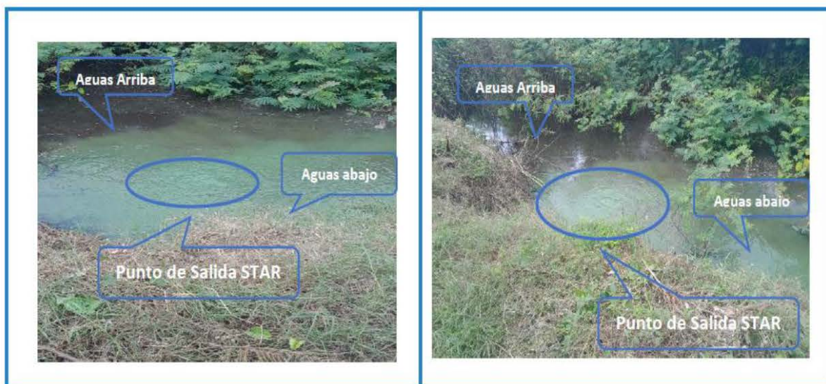
Ilustración 8. Salida Punto de Vertimiento de descarga STAR Campo de la Cruz.

Sin embargo, es importante contextualizar que, durante la visita técnica de inspección ocular agendada para el día 22 de noviembre de 20221 con el acompañamiento de la Inspección municipal de campo de la Cruz, la Agencia de Desarrollo Rural – ADR, Corporación Autónoma Regional del Atlántico – CRA, Secretaria de Salud del Dpto. del Atlántico, Secretaria de Agua del Dpto. del Atlántico, ARESUR S.A E.S.P. y el Operador de Servicio de Acueducto y Alcantarillado Aguas del Sur del Atlántico S.A. E.S.P. se evidencia que en el punto de descarga de las Agua residuales al Caño denominado “La Ensenada” se verifica visualmente que la salida del agua residual en el punto de vertimiento es de tonalidad clara, en comparación con aguas arriba del punto de vertimiento (color Negro).