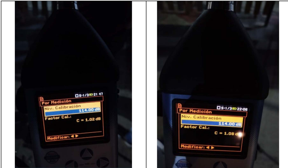
Calibración de sonómetro para medición con fuente apagada.