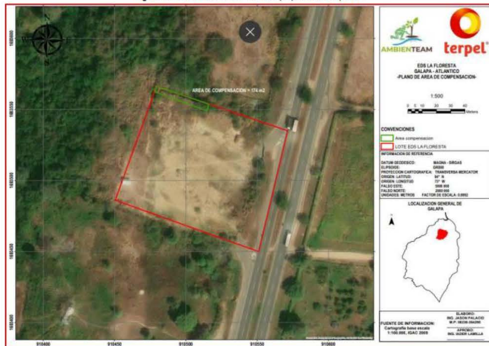
Figura 1. Plano de localización del área propuesta a compensar.

Nota: Para mejor visualización revisar Anexo 2.