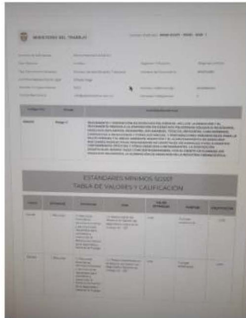
Imagen 5, 6 y 7 actas del comité vigía de salud del programa de seguridad y salud en trabajo

(57-5) 3492482 – 3492686 repcion@crautonomia.gov.co Calle 66 No. 54 -43 Barranquilla - Atlántico Colombia www.crautonomia.gov.co