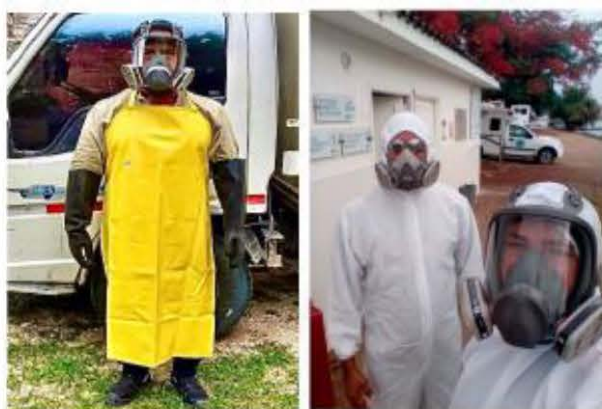
Imagen 7 y 8 Personal con los EPP

El personal cuenta con elementos de protección personal. Los EPP que utilizan son delantal guantes tipo mosquetero y mascara de protección fácil zapato cerrado