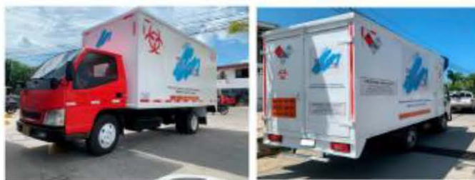
Foto 1 y 2 Vehículo tipo furgón para la recolección de los residuos hospitalarios en jurisdicción de la CRA

Transporte mixto de residuos (hospitalarios, aceites y RAEE) cuentan con dos compartimentos totalmente aislados en el furgón de transporte. El almacenamiento durante el transporte sólo puede hacerse en el área específica de cada tipo de residuo.