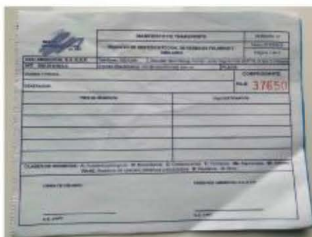
Imagen 10 Manifiesto recolección entregado por la empresa Red Ambiental al Generador cuando realiza la recolección

La empresa Red Ambiental S.A. E.S.P. cuenta con formato para manifiesto de carga indicando la clase, cantidad de residuos con el nombre del generador, destino, fecha del transporte, firma de quien entrega, nombre del conductor y placa del vehículo.