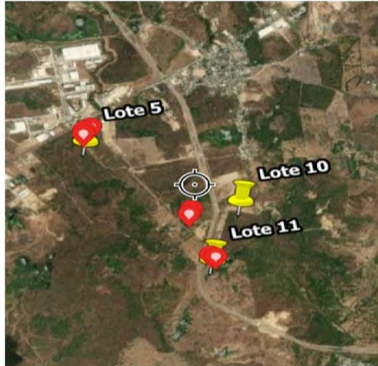
Ilustración 3: Puntos tomados en la visita técnica