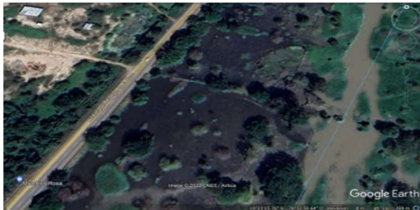
Ilustración 2 - Punto de descargue objeto del acto vandálico e inundación.

Posteriormente, se presentó el hurto en el emisario final de 200 metros de tubería de polietileno de 10" (Ver Anexo 1 - Denuncia), daños de la acometida en media tensión en el tramo EBAR Norte – Lagunas y como último sabotaje, recientemente se presentó el hurto de 3 cañuelas en la EBAR Norte (Ver Anexo 2 - Denuncia).