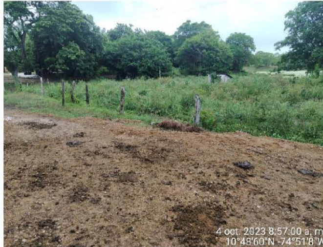
Foto No. 4. Fecha: 04 de octubre de 2023. Ubicación: Finca San José, Corregimiento de Pitalito en el Municipio de Malambo. Observaciones: Vista del cuerpo de agua (Arroyo) y su cauce, con abundante flora silvestre.

“POR MEDIO DEL CUAL SE REQUIERE A LA EMPRESA SDGE ENERGIAS RENOVABLES S.A.S E.S.P., Y SE DICTAN OTRAS OBLIGACIONES”