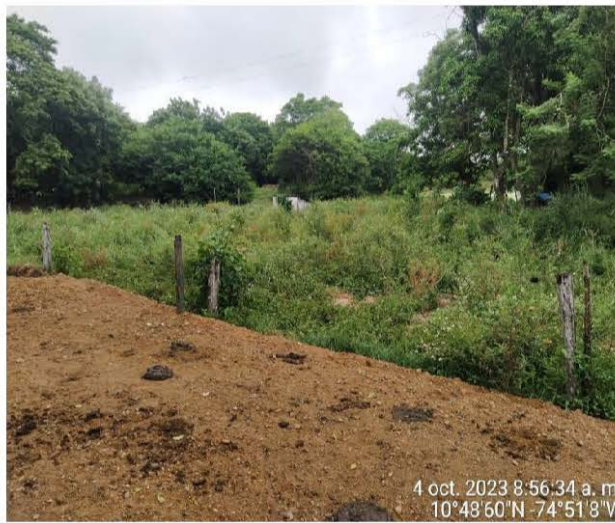
Foto No. 3. Fecha: 04 de octubre de 2023. Ubicación: Finca San José, Corregimiento de Pitalito en el Municipio de Malambo. Observaciones: Vista del cuerpo de agua (Arroyo), con abundante flora silvestre.