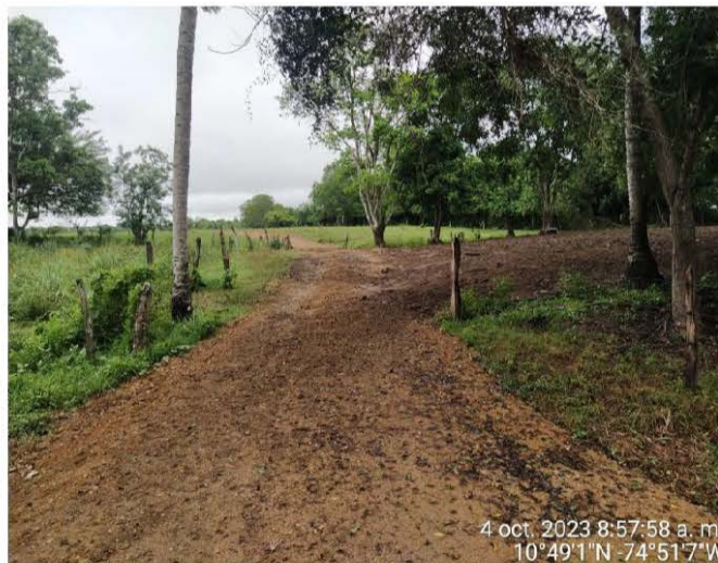
Foto No. 5. Propia. Fecha: 04 de octubre de 2023. Ubicación: Finca San José, Corregimiento de Pitalito en el Municipio de Malambo. Observaciones: Vista del paso en material de relleno sobre el cauce del Arroyo.