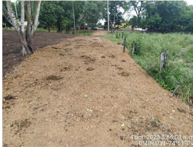
Foto No. 2. Propia. Fecha: 04 de octubre de 2023. Ubicación: Finca San José, Corregimiento de Pitalito en el Municipio de Malambo. Observaciones: Paso sobre el Arroyo donde se proyecta construir la estructura, con material de relleno extendido.

“POR MEDIO DEL CUAL SE REQUIERE A LA EMPRESA SDGE ENERGIAS RENOVABLES S.A.S E.S.P., Y SE DICTAN OTRAS OBLIGACIONES”