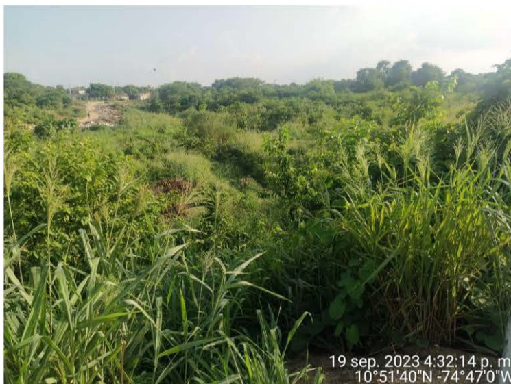
Foto No. 3. Fecha: 19 de septiembre de 2023. Ubicación: Casco urbano Municipio de Malambo, vía Caracolí - Malambo. Observaciones: Densa Vegetación y gran cantidad de residuos sólidos.

19 sep. 2023 4:32:14 p. m. 10°51'40"N -74°47'0"W