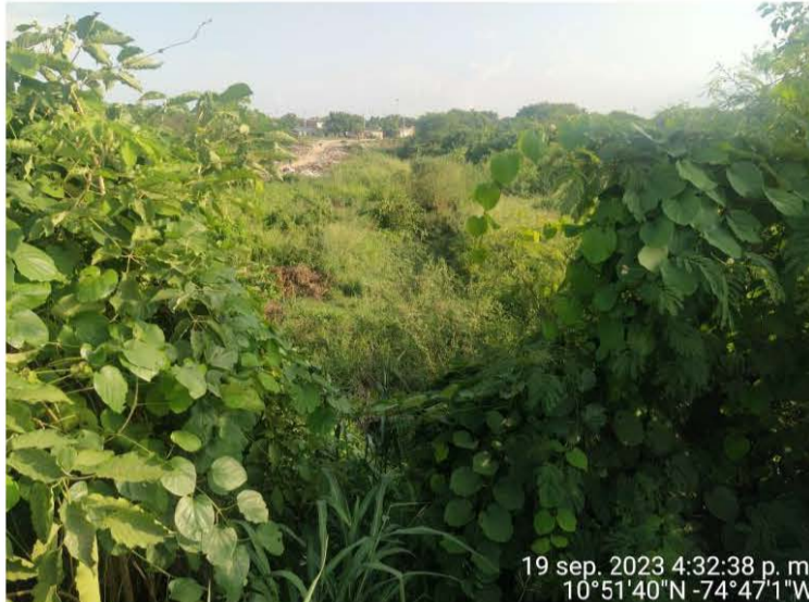
Foto No. 5. Fecha: 19 de septiembre de 2023. Ubicación: Casco urbano Municipio de Malambo, vía Caracolí - Malambo. Observaciones: No se puede visualizar el Box Culvert y es posible el acceso al predio.

“POR MEDIO DEL CUAL SE REQUIERE A DIONISIO NARVAEZ ACOSTA MERCADO IDENTIFICADO CON C.C 7.439.886, Y SE DICTAN OTRAS DISPOSICIONES”