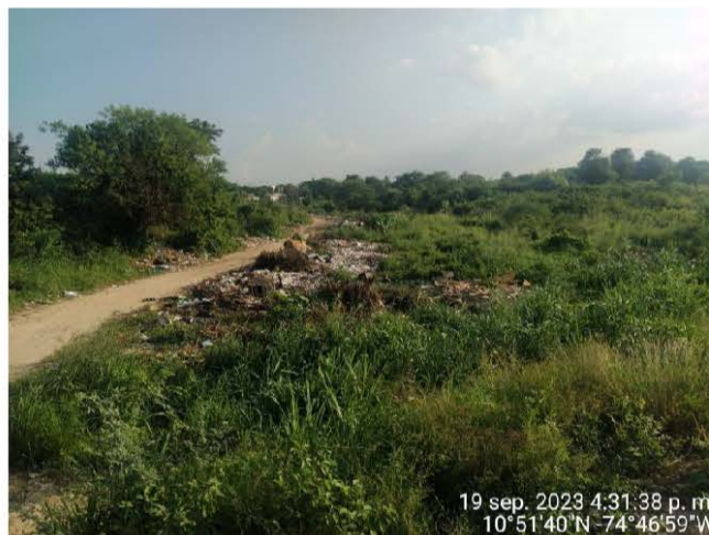
Foto No. 2. Propia. Fecha: 19 de septiembre de 2023. Ubicación: Casco urbano Municipio de Malambo, vía Caracolí - Malambo. Observaciones: Predio con matrícula inmobiliaria 041-179406, para adecuación de escorrentía.

A continuación, se relacionan y numeran las imágenes fotográficas tomadas en el sitio de interés durante la visita y/o recorrido efectuado.