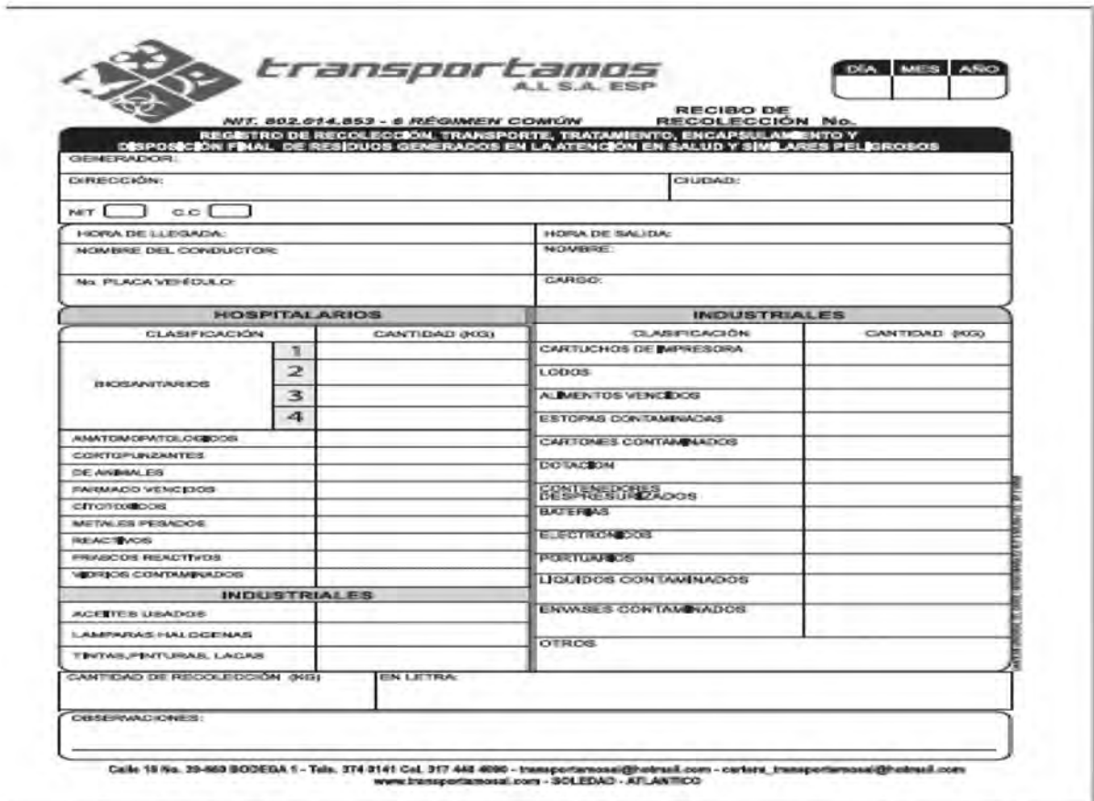
Imagen 3 – Manifiesto de recolección de TRANSPORTAMOS A.L. S.A. E.S.P., el cual es entregado al generador de RESPEL cuando se realiza la recolección.

(57-5) 3492482 – 3492686 repcion@crautonoma.gov.co Calle 66 No. 54 -43 Barranquilla - Atlántico Colombia www.crautonomia.gov.co